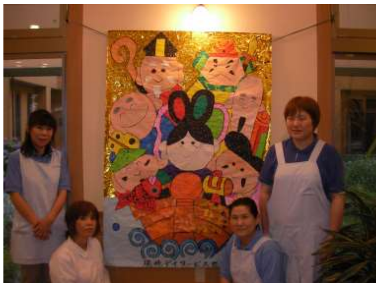
心よりお待ちしております！！(^v^)