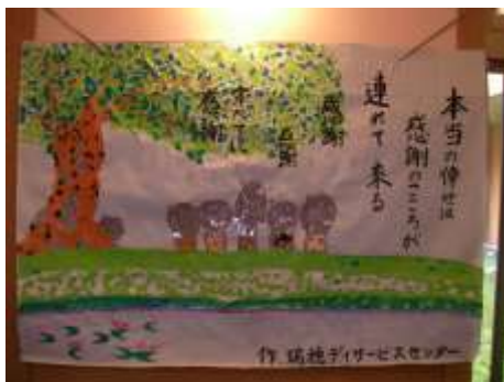
みんなで頑張りました！