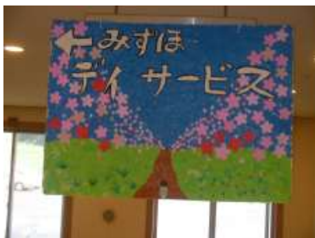
春は外苑に桜が満開です！