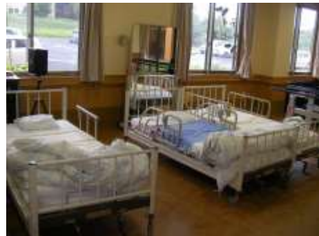
疲れた時は休む事もできます ☺