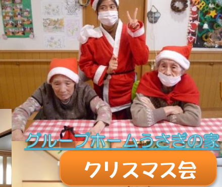
グループホームうさぎの家