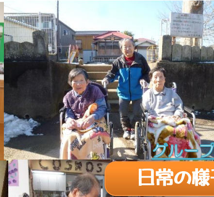
グループホームうさぎの家