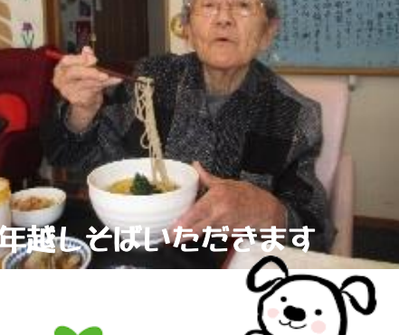
年越しそばいただきます