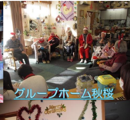
グループホーム秋桜