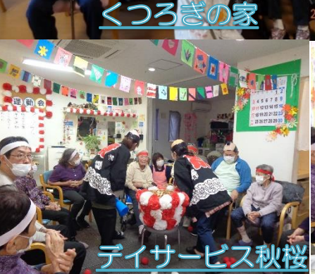
デイサービス秋桜