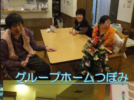
グループホームつぼみ