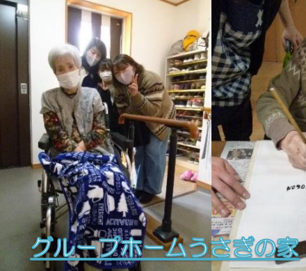
グループホームうさぎの家