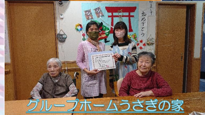
グループホームうさぎの家

技能実習生として入職し2年5ヶ月が経ち、すっかり秋桜の職員として各事業所にも馴染んだ3人が介護技能実習評価試験に挑み見事合格しました！ 筆記試験の他、実技試験では食事介助、車いすの移動の介護、移乗、感染症予防についてなど、実践に即した試験が行われ日頃の成果を発揮できたようです。