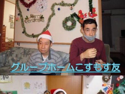
グループホームこすもす友