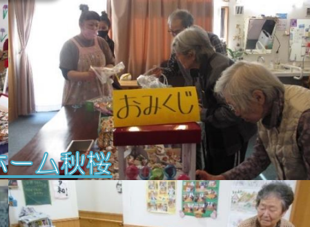
グループホーム秋桜