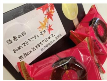
長寿を祝い、全員に「バウムクーヘン」を贈らせていただきました(^_-)-☆

敬老の日を迎えられ、心よりお慶び申し上げます。 9月20日敬老の日は各事業所でお祝いの会を開催いたしました。昼食には、お赤飯や天ぷらなどのお祝い膳を召し上がっていただき、代表の長寿の方に賞状をおくり、感謝の気持ちを込めて職員一同お祝いをさせていただきました。皆さま笑顔でゆっくり過ごされたお祝いの会となりました。これからもどうぞお元気でお願いします。