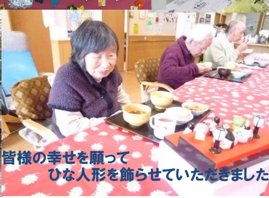
皆様の幸せを願って ひな人形を飾らせていただきました