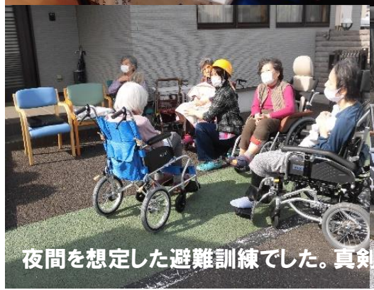
夜間を想定した避難訓練でした。真剣に取り組んでいる様子が伝わります！