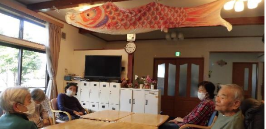
リビングに鯉のぼりを飾りました