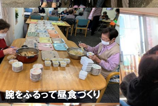
腕をふるって昼食づくり