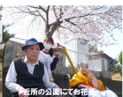
近所の公園にてお花見