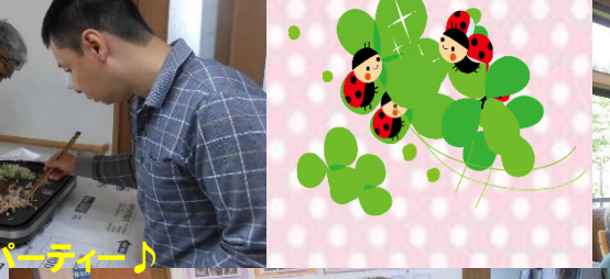
焼きそばパーティー♪