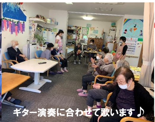
ギター演奏に合わせて歌います♪