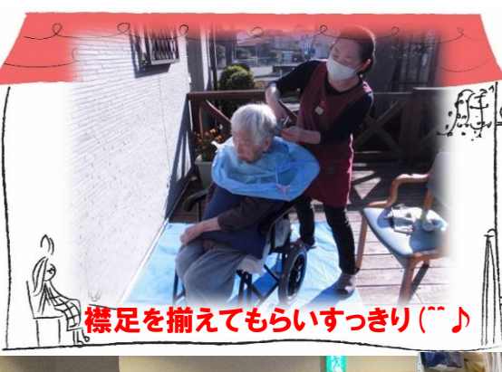
襟足を揃えてもらいすっきり(´▽`)