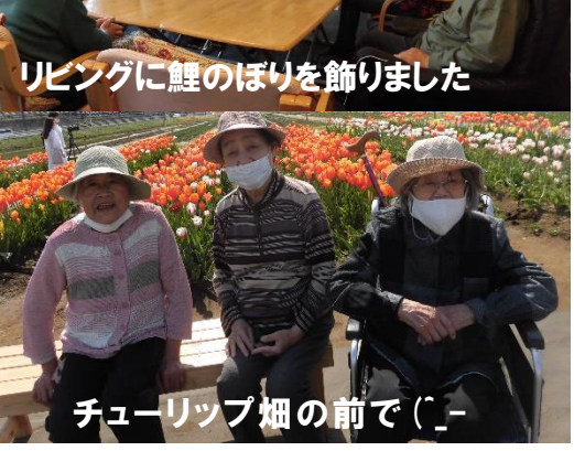
チューリップ畑の前で(´▽`)