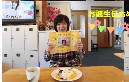
お誕生日おめでとうございます