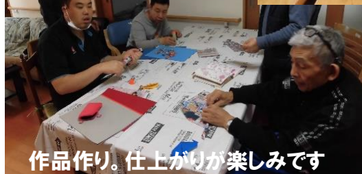
作品作り。仕上がりが楽しみです