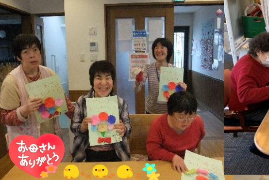
お母さん ありがとう