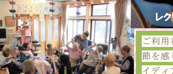
理学療法士による機能訓

ご利用者さまが少しでも日本古来の伝統や季節を感じることができるようにと、職員でアイデアを出し合いながら行事やレクリエーションを計画しております。