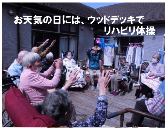
お天気の日には、ウッドデッキで リハビリ体操