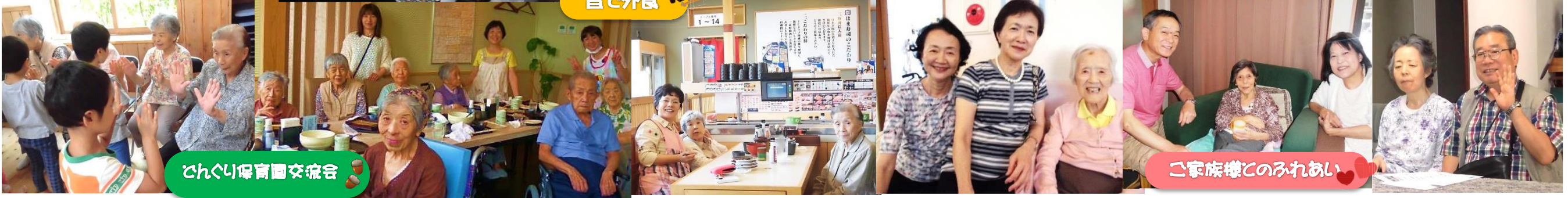
ひんぐり保育園交流会