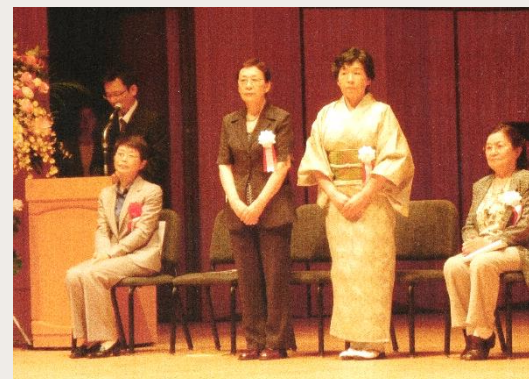
20周年記念式典の様子 (平成25年6月21日)