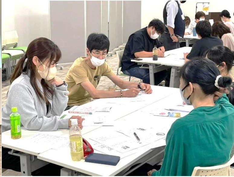
グループワークでは、活発な発言が飛び交いました。