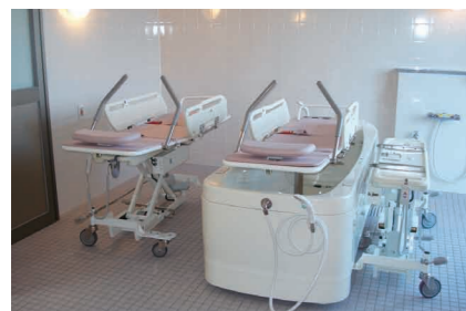
特殊浴(ストレッチャータイプ)