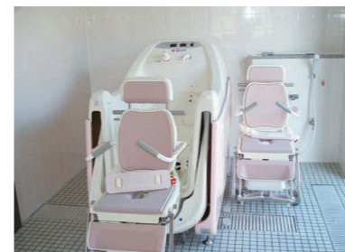
特殊浴(チェアイン)