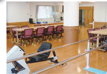
デイルーム 機能訓練室