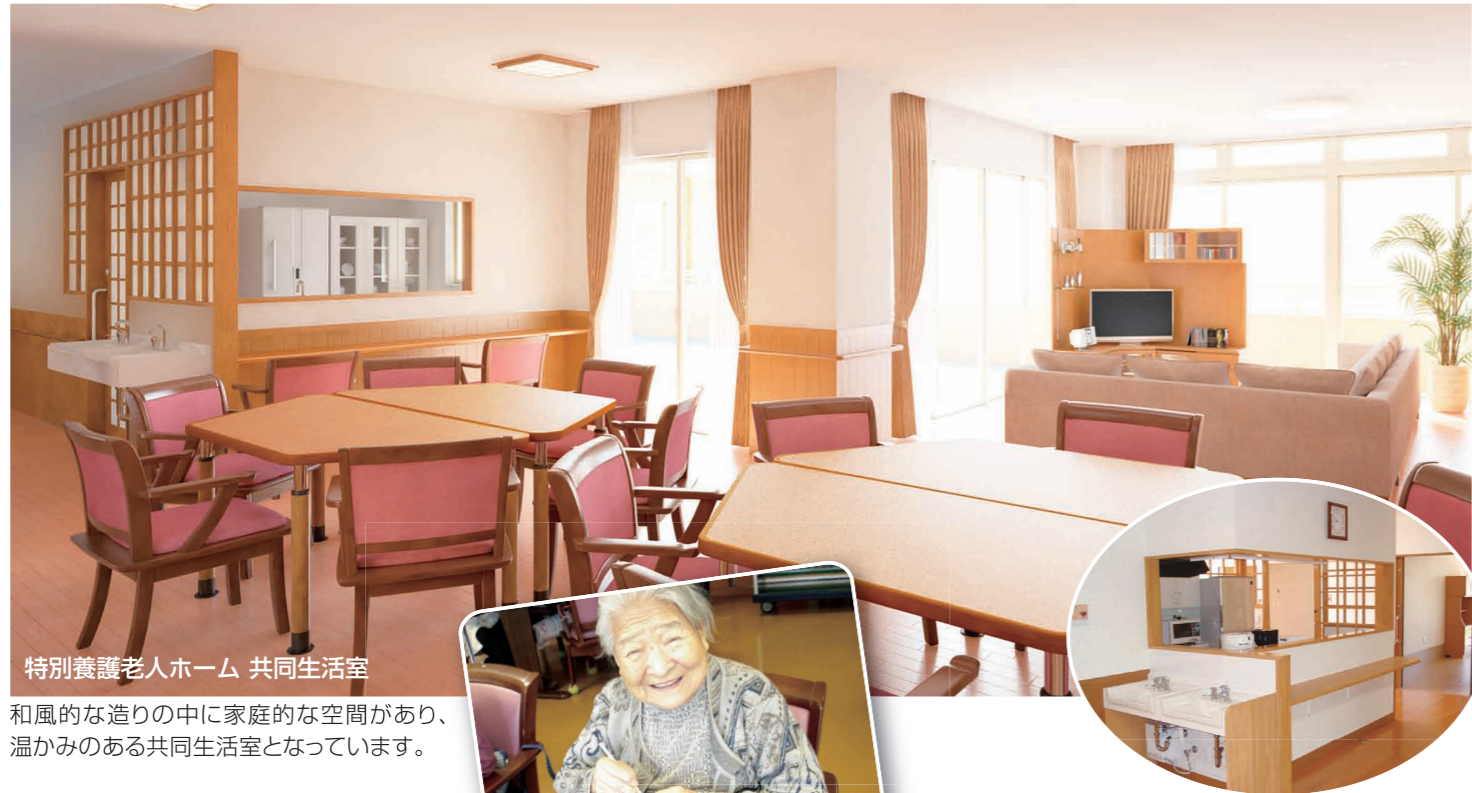
特別養護老人ホーム 共同生活室

ひがしまつやま寿苑は、地域密着型の特別養護老人ホームです。全室個室の施設で、入居は原則東松山市在住の方に限られており、住み慣れた地域で住み慣れた自宅と同様の環境で生活できます。少人数だからこそ、入居者と職員がより身近に感じあい、寄り添うことによって個々の生活および人格を尊重しながら生活していただけます。