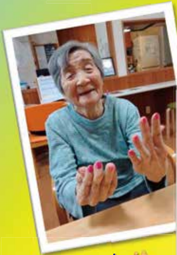
ネイルアート で気分転換