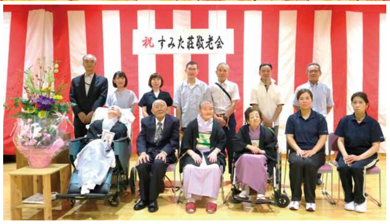
～ すみた荘敬老会より ～