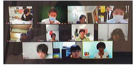
実際の研修のようす