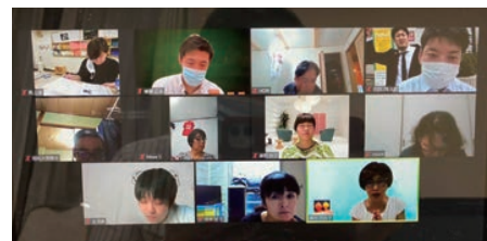
実際の研修のようす