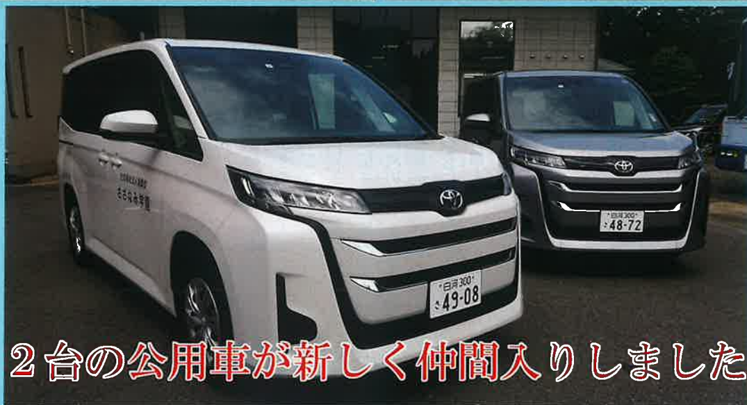
2台の公用車が新しく仲間入りしました