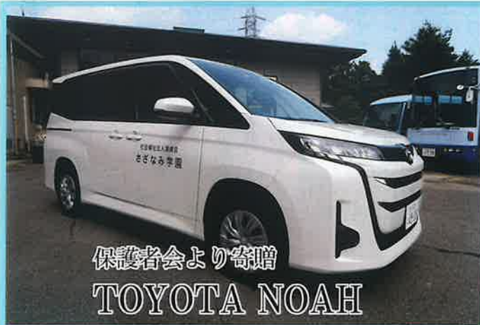
保護者会より寄贈