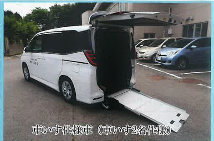
車いす仕様車 (車いす2名仕様)