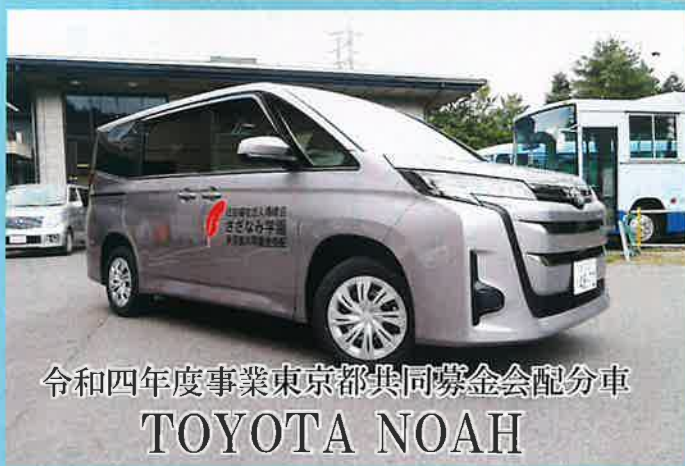
令和四年度事業東京都共同募金会配分車