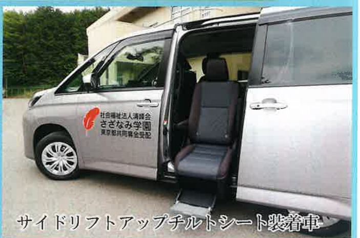
サイドリフトアップチルトシート装着車