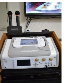
最新カラオケシステム完備