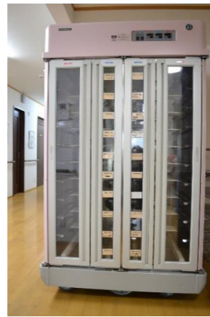
温冷配膳車でおいしさそのまま