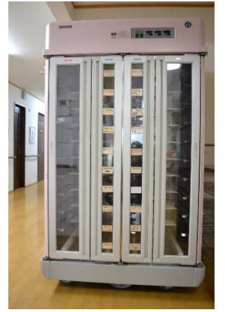
温冷配膳車でおいしさそのまま