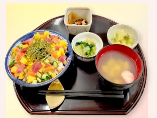
行事食/ちらし寿司

毎日の昼食は東陽館の厨房で「真空調理」にて手作りしております。素材本来の味を逃がさず、柔らかくジューシーと大変好評を頂いております。