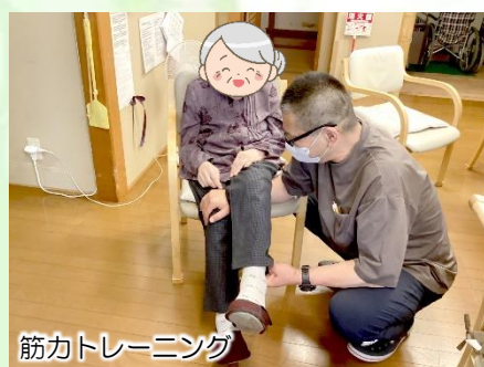
筋力トレーニング