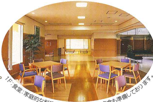
1F:食堂:家庭的な料理と季節感あふれる行事食も準備しております。