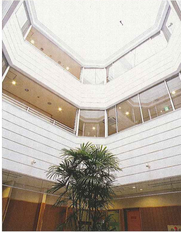
広々とした吹き抜けの空間が設けられ、トップライトと呼ばれる強化ガラスを使用した屋根から差し込む日差しと、夜の星空が楽しめる設計になっています。