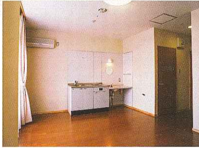
1人部屋で、お部屋は全室フローリング張りです。