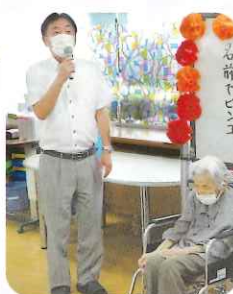
施設長よりお祝いの言葉