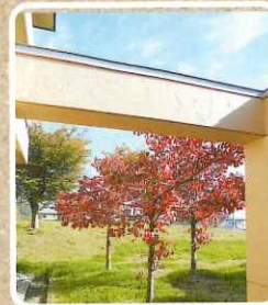
紅葉がキレイです