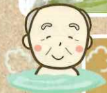
ゆったりと した洗い場