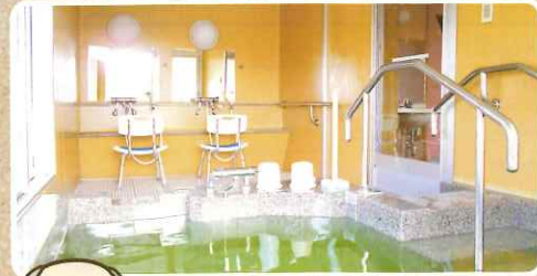
温かみのある 木目調つくり