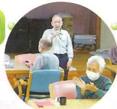
お祝いの歌 さんさしぐれ