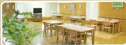
食堂も広々と しています