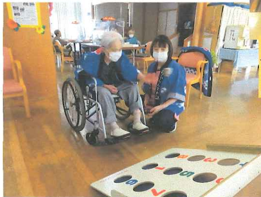
▲的が9コもあるんだが入っべ～

ご利用の皆さんも祭りの法被を羽織ってお祭りムードを感じながら、的入れゲームに金魚すくいを楽しんでいる写真です。特に金魚すくいは人気があり、ポイが破れるまで20匹も30匹もすくう人が多く皆さんお上手でした。そんな中、上手く行かなかった人も…ポイを水につけたまま時間が過ぎてしまい破れやすくなったのが原因かなって思います。金魚すくいの上手い人は是非、お祭りの露店でも腕前を発揮してみてくださいはいかがでしょうか。