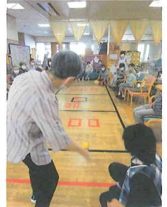
△「どこさ入れるといいのや?」