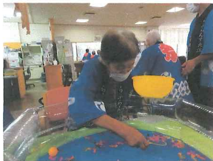
△「ほれ!赤い出目金逃げんな!!」