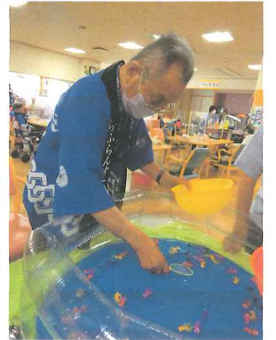
△「昔から捕まえるのは得意なのよ」

ご利用の皆さんも祭りの法被を羽織ってお祭りムードを感じながら、的入れゲームに金魚すくいを楽しんでいる写真です。特に金魚すくいは人気があり、ポイが破れるまで20匹も30匹もすくう人が多く皆さんお上手でした。そんな中、上手く行かなかった人も…ポイを水につけたまま時間が過ぎてしまい破れやすくなったのが原因かなって思います。金魚すくいの上手い人は是非、お祭りの露店でも腕前を発揮してみてくださいはいかがでしょうか。