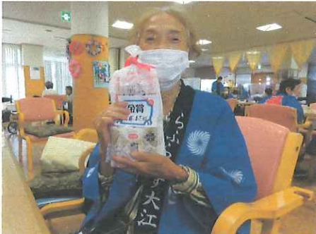
△くじ引きで金賞があたりました。

♪花の山形～紅葉の天童～雪を(チョイチョイ)眺むる尾花沢(ハ ヤッシヨ マカシヨ シャンシャンシャン)と皆さんで踊れる花笠踊り