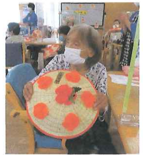
♪シャンシャンシャン♪