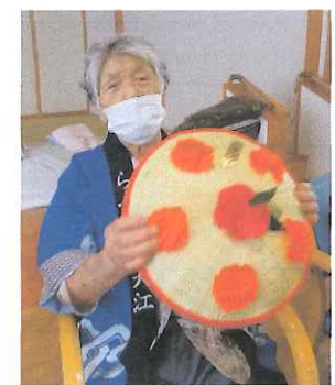
ヤッショー♪マカショー♪

8月9日～11日までの3日間は、恒例のデイサービス『夏まつり』を行ないました。花笠踊りから始まり、夏まつりらしい音楽をバックに、金魚すくいやターゲットゲーム、景品の当たるくじ引きを行いました。また、テーブルでは、ノンアルコールビールやラムネ等の飲み物を飲みながら、少しばかりの“お祭り気分”を楽しんでいただきました。