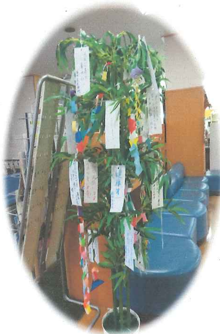
△願いを込めた短冊