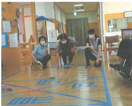
▲高得点目掛けて「それ～」

ペタンクと言うゲームは、空き缶を転がして、床に数字が書かれてあるところに止まると点数が加算され、それで競うゲームです。