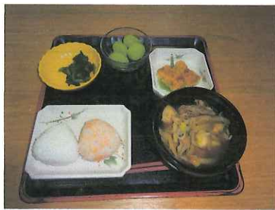
△おにぎりがついて芋煮の味も最高!

山形で「秋の味覚」と言えば、芋煮会を想像する方も多いと思います。今年もデイサービスご利用の皆様にも芋煮を味わってもらいました。本来なら青空の下、行うことが出来れば良いのですが、天気と衛生面を考慮して、屋内での芋煮会となりました。それでも皆さんからは「うまい! うまい!!!」と好評をいただきました。