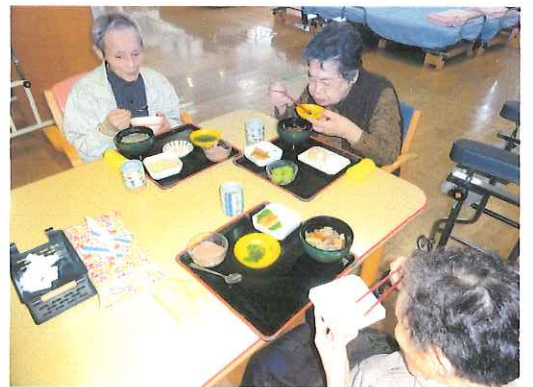
「うまくて御代わりするが」「ブドウもうめえ～」

山形で「秋の味覚」と言えば、芋煮会を想像する方も多いと思います。今年もデイサービスご利用の皆様にも芋煮を味わってもらいました。本来なら青空の下、行うことが出来れば良いのですが、天気と衛生面を考慮して、屋内での芋煮会となりました。それでも皆さんからは「うまい! うまい!!!」と好評をいただきました。