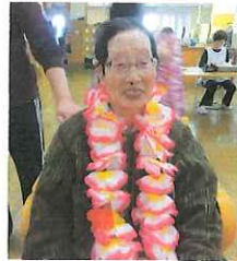
とってもステキな笑顔