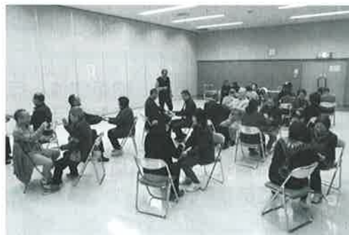
サロン活動サポーター養成講座 ステップアップ