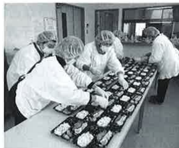
調理ボランティア