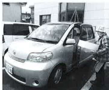
配食ボランティア