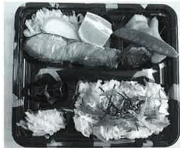
高齢者向きの手づくり弁当