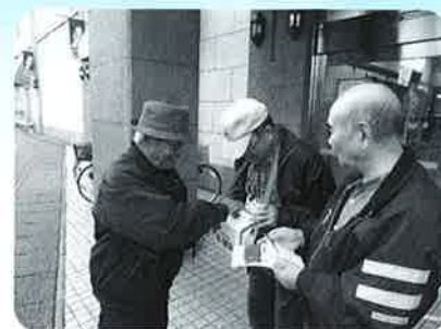
上山市民生児童委員連絡協議会