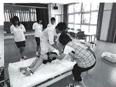
▲福祉施設での介護体験（高校生）