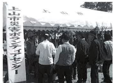
市総合防災訓練の様子

期 日：平成23年10月16日(日) 午前9時から 午後12時30分まで 場 所：上山市立宮生小学校 (各自現地集合) プログラム：災害ボランティアセンターの立上げと災害ボランティアの調整等