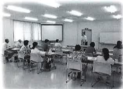
サロンの現状を学ぶ