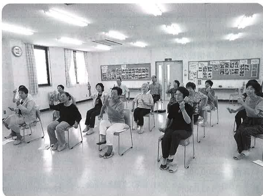
歌って笑って楽しいひととき（音楽療法）