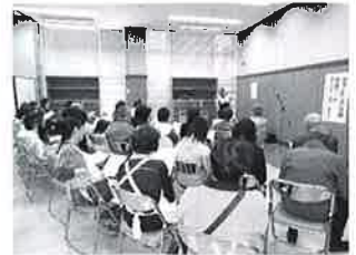
ボランティア活動発表