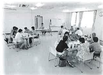
サロンづくりの グループ討議

☎ 社会福祉法人 上山市社会福祉協議会 〒999-3135 上山市南町4番5-12号 ☎695-5095 e-mail : ka-syakyo@ic-net.or.jp HP : http://care-net.biz/06/kaminoyama/