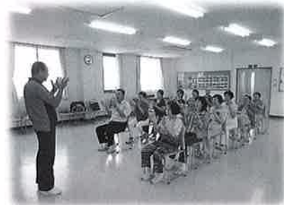
サロンで役立つ レクリエーション