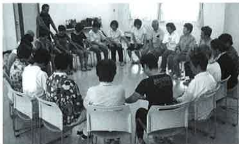
レクリエーションの様子

『ふれあい・いきいきサロン』は高齢者等の居場所づくりや介護予防の一環として、地域全体で取り組む活動です。地域の実情に応じたメニューで、自主的に身近な場所で開催されています。