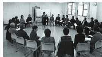
傾聴についての講座