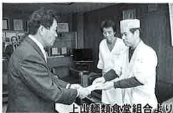
上山麵類食堂組合より