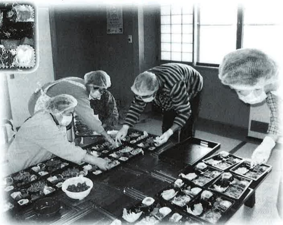
高齢者1人暮らし食事サービス(松山地区)