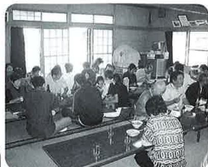
ふれあい会食会(石堂地区)