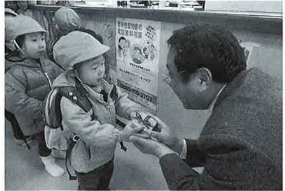
めぐみこども園より