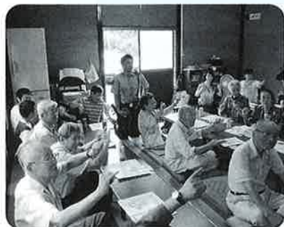
福祉レクリエーション(荒町地区)