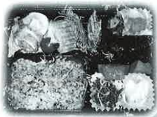
手づくりの お正月料理