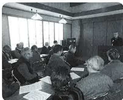
福祉研修会(高松地区)