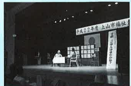
認知症をテーマにした寸劇の様子

地域包括支援センターでは、認知症になっても住みやすい地域づくりを目指し、『認知症サポーター養成講座』の開催や、認知症にまつわる寸劇などの出前講座を行っています。