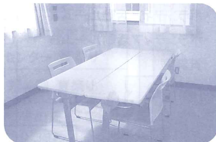
ボランティア活動ルーム