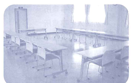
研修室C 研修会や講座で活用