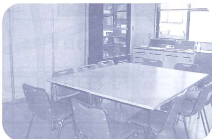
研修室A 交流サロン等で活用

今後、市民が気軽に集うことができる交流サロン等を開設し、ボランティア等がその運営をサポートする体制を敷いて、街中の居場所づくりを推進します。