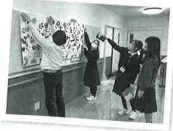
手作りの装飾で会場が華やかに

当日は、学生ボランティアが考えたレクリエーションや施設入所者の昔からの夢であった、「ご家族とのピアノの演奏(連弾)」を行いました。美しいピアノの演奏は、入所者のご家族や施設職員、学生ボランティア等の参加者全員に感動を与え、思い出に残るミニ・コンサートとなりました。