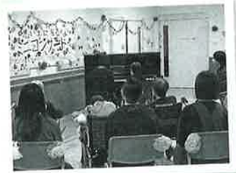
施設入所者とご家族と一緒にピアノを演奏(連弾)