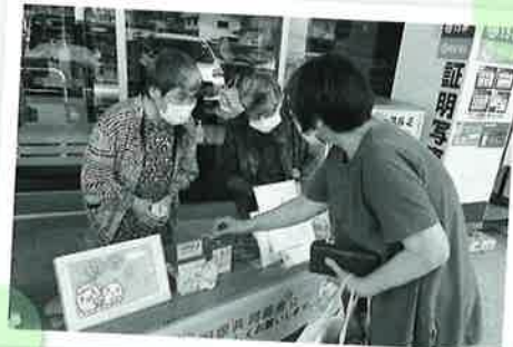
共同募金運動（街頭募金）