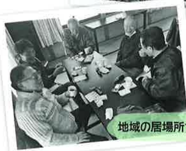
地域の居場所づくりのために