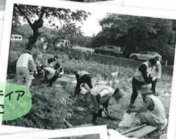
災害ボランティア 活動のために