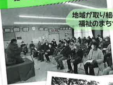
地域が取り組む 福祉のまちづくりのために