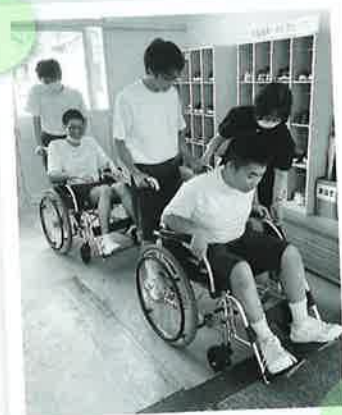
福祉学習（高齢者疑似体験）