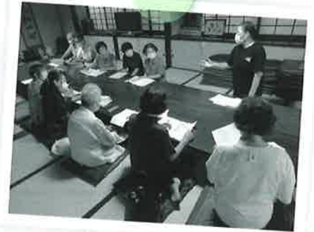
ふれあい・いきいきサロンづくり （サロン活動サポーター養成講座）