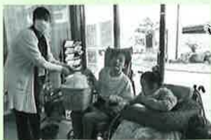
生活介護事業所「こ・こあハウス」様