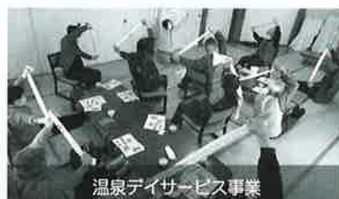
温泉デイサービス事業