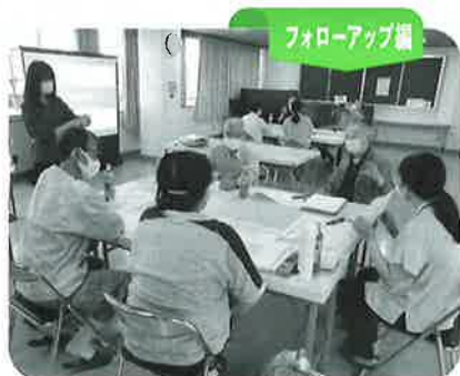
フォローアップ編

参加者からは、「講師の方からの事例紹介や、他の地区の活動について話を聞くことができてよかった。」との感想が聞かれました。