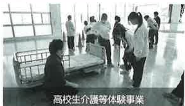
高校生介護等体験事業