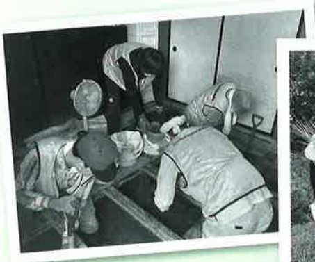
川西町での活動の様子