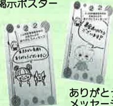
ありがとうメッセージ