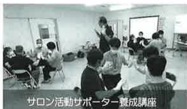
サロン活動サポーター養成講座