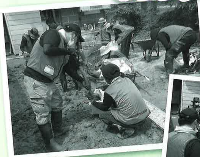
飯豊町での活動の様子