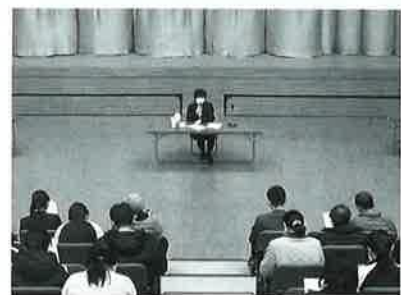
※感染対策に十分配慮し実施いたしました。

※社会資源とは…生活するうえで起こる様々な課題を解決するために、日々の生活において利用可能な「すべてのもの」とされています。（例）介護保険サービス、近隣住民、ボランティア団体等