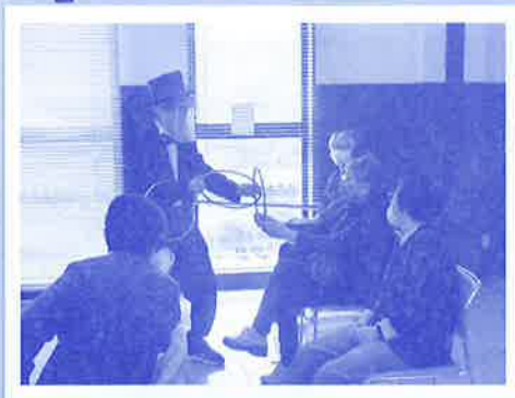
リングを用いたマジック

令和3年5月24日（月）に矢来1・2・3地区合同駅前いきいきサロンの中で、マジックショーを披露している様子です。