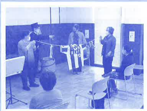
ひも等を用いたマジック