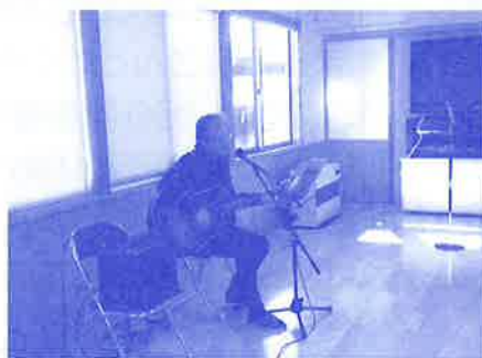
ギター演奏の活動風景

社協へボランティア登録する旨を電話にてご連絡ください。登録票を社協より郵送いたしますので、記入の上FAXまたは郵送でご返信ください。