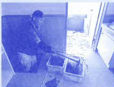
床下の泥出しの様子