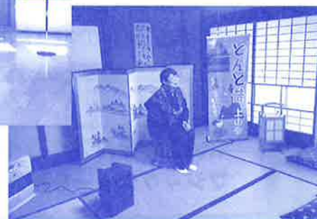
とんと昔の活動風景

※現在、新型コロナウイルス感染症の予防に十分配慮しながら、ボランティアの皆さまが活動されています。