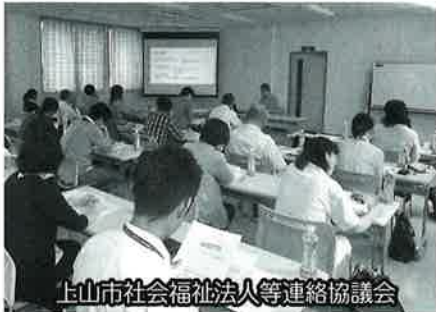
上市市社会福祉法人等連絡協議会