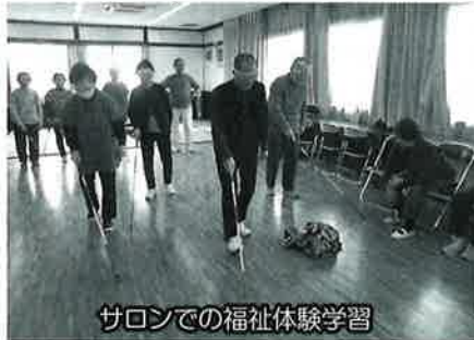
サロンでの福祉体験学習