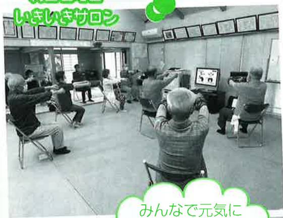
みんなで元気に 百歳体操

活動が自粛されたことによって、自宅での閉じこもりや、運動不足による体力の低下、地域のつながりの希薄化などを心配する声がありました。そのような中だからこそ、今できる範囲で、居場所づくり等のつながりを絶やさないうきみが重要となってきます。感染症の予防を心がけながら、まずはできることから取り組んでみませんか？