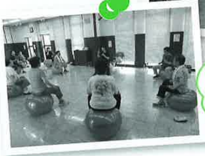
バランスボール教室 でリラックス