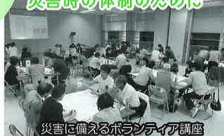
災害に備えるボランティア講座