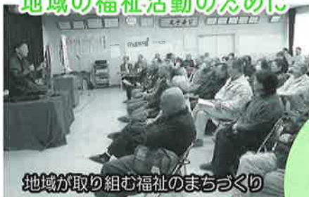
地域が取り組む福祉のまちづくり