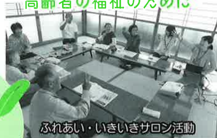
ふれあい・いきいきサロン活動