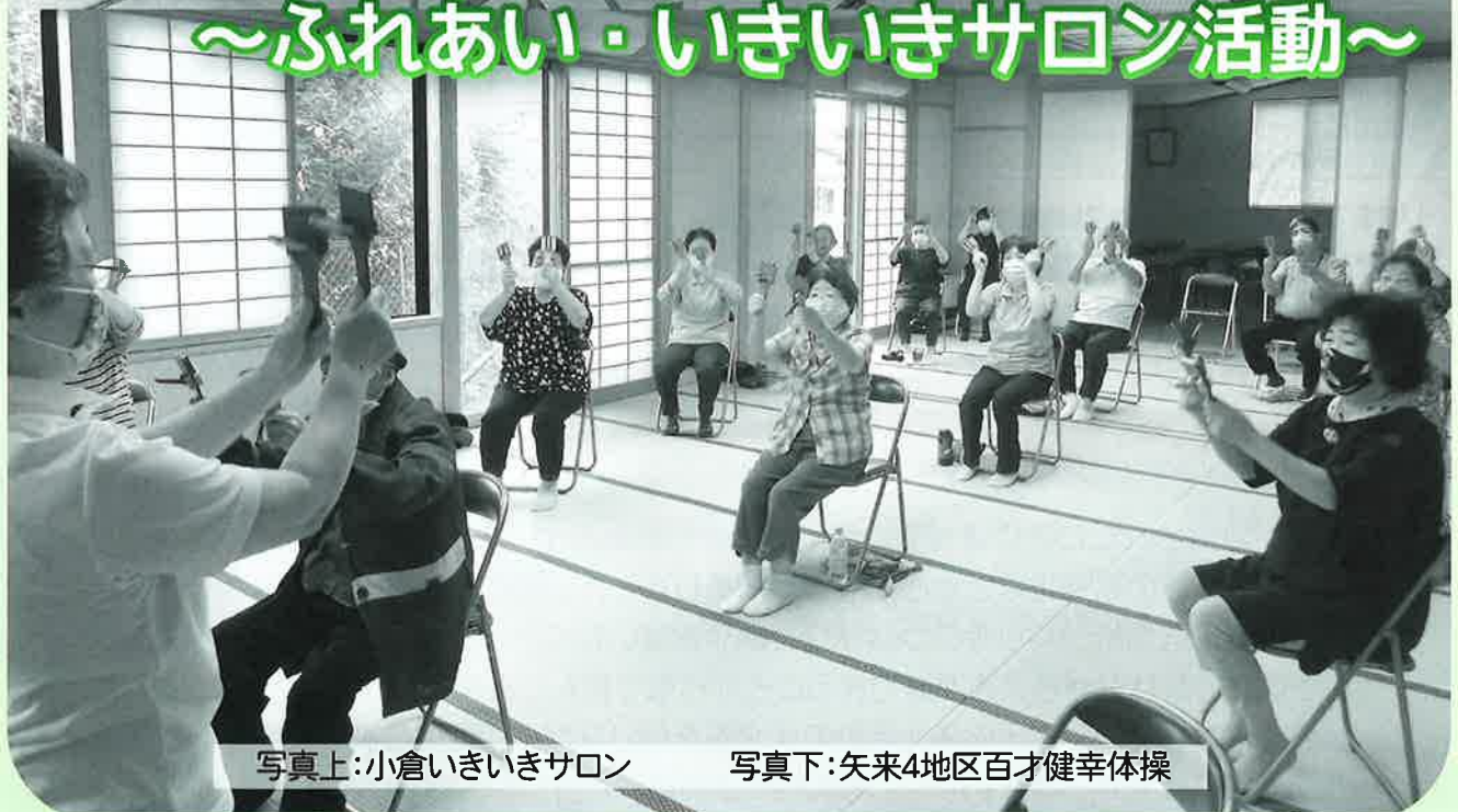
写真上:小倉いきいきサロン