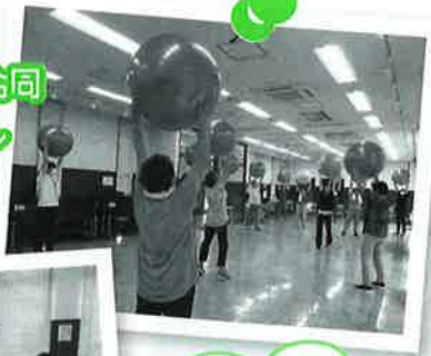
矢来1・2・3地区合同 駅前いきいきサロン