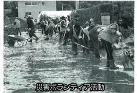
災害ボランティア活動