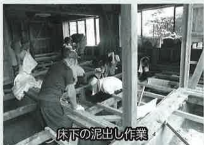
床下の泥出し作業

令和2年7月27日からの豪雨により、山形県内の広範囲で甚大な被害が発生しました。社協では、災害ボランティア登録者、上山青年会議所のメンバー、上山市社会福祉法人等連絡協議会に登録している施設の職員等、たくさんの方々にご協力いただき、上山市をはじめ、河北町、大江町、村山市、大蔵村でボランティア活動を行いました。