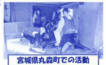
宮城県丸森町での活動