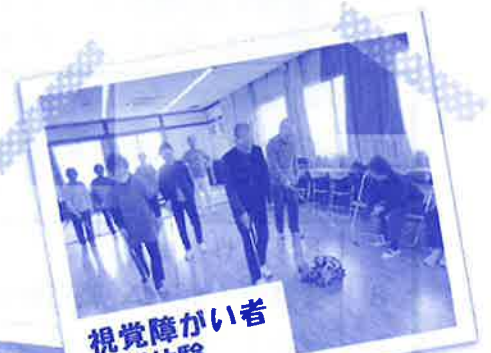
視覚障がい者疑似体験