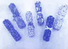
ヤクルトシェイカー