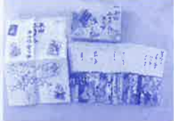
上山ふるさとカルタ