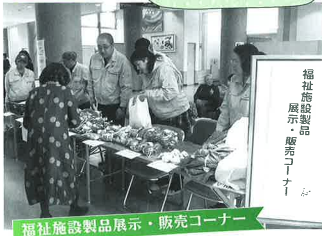
福祉施設製品展示・販売コーナー