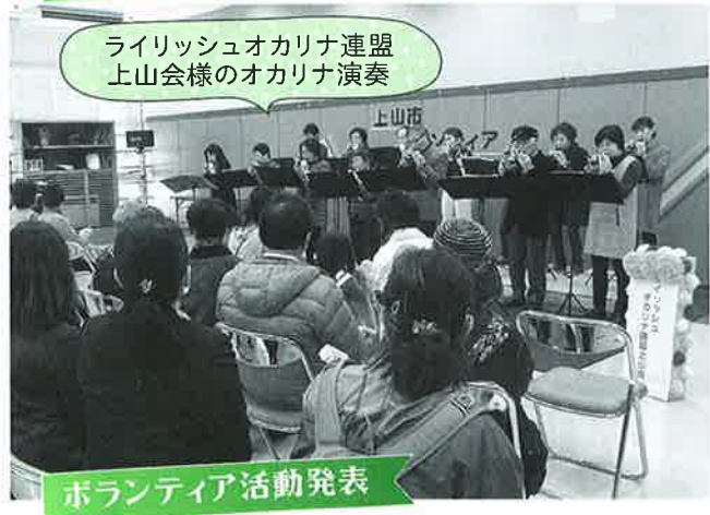
ライリッシュオカリナ連盟 上山会様のオカリナ演奏