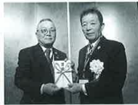
上山ロータリークラブ様