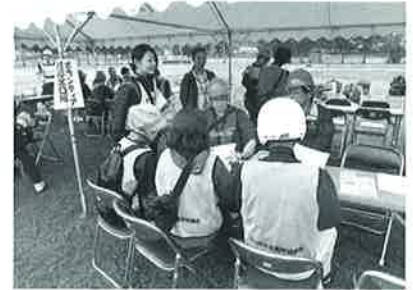
災害に備えるボランティア研修会

福祉のまちづくりの促進のため、身近な居場所づくりの推進、福祉教育の実施、災害時の支援体制の整備、福祉団体・ボランティアへの支援等、幅広く活用されます。