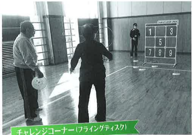
チャレンジコーナー(フライングディスク)