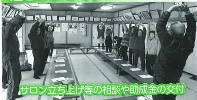
サロン立ち上げ等の相談や助成金の交付