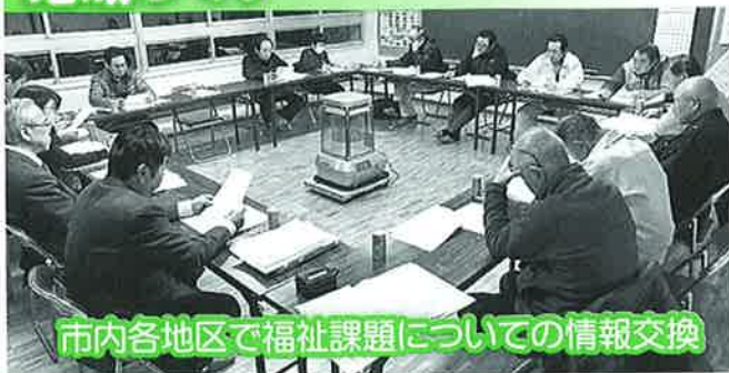
市内各地区で福祉課題についての情報交換