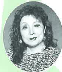
萩生田千津子氏 (上山市出身・女優)

チケット：500円（10月15日より販売開始） ※売上金は、市内の障がい児・者福祉施設へ 寄付されます。