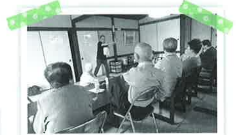
自作の脳トレを使って、サロン参加者の皆様と楽しんでいます。

サロンの課題の1つに「サロンに行くまでの交通手段がないこと」があります。現在は、ボランティア保険を利用して参加者の中から5人が送迎できるようにしています。今後はさらに、身体が不自由な方でも参加できるよう工夫していきたいです。