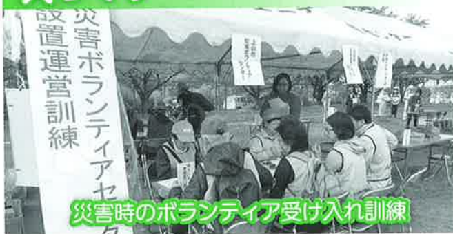
災害時のボランティア受け入れ訓練