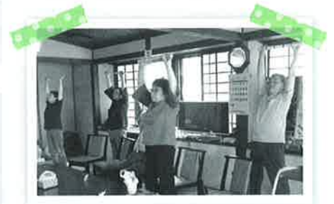
みよしサロンは、皆様で相談して活動メニュー決めていきます。