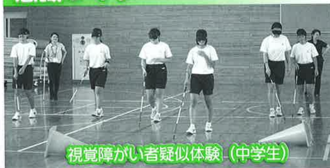
視覚障がい者疑似体験（中学生）