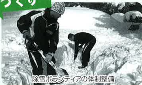
除雪ボランティアの体制整備

市民の方々が、ボランティア活動に興味や関心を持ち、活動がより活発になるよう、情報発信や学習の場を充実させ、ボランティアの輪を広げていきます。