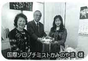
国際ソロプチミストかみのやま 様