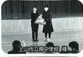
上山市立南中学校 様