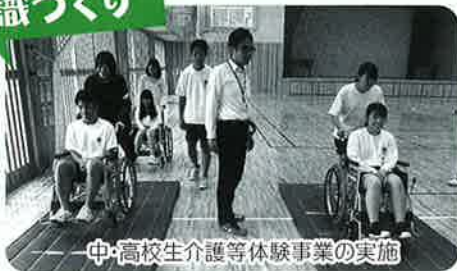
中・高校生介護等体験事業の実施

福祉活動に対する市民の意識と関心が高まるように、地域や学校と連携を図り、福祉意識を高揚し、共に支え合う地域づくりを推進します。