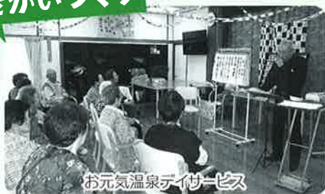
お元気温泉デイサービス