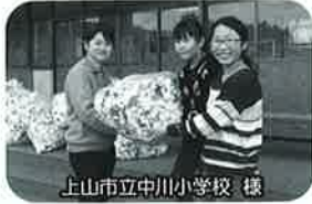
上山市立中川小学校 様