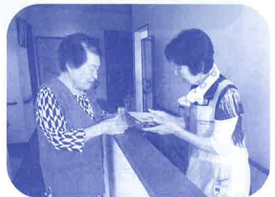
お弁当を手渡しでお渡ししています!

◆実費弁償費：自家用車を提供していただいた場合は、ガソリン代として、1回につき600円