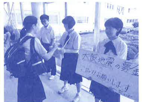
校内募金活動（上山市立北中学校）