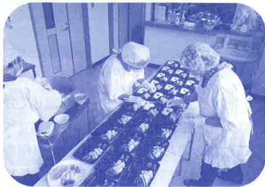
心を込めて作っています!

調理ボランティアが手作りの昼食弁当を作成して、配食ボランティアが利用者宅へ配達しており、利用されている方からは「毎回楽しみに待っています。ありがとう。」といった、温かい声をいただいています。一緒に活動をしてみませんか?