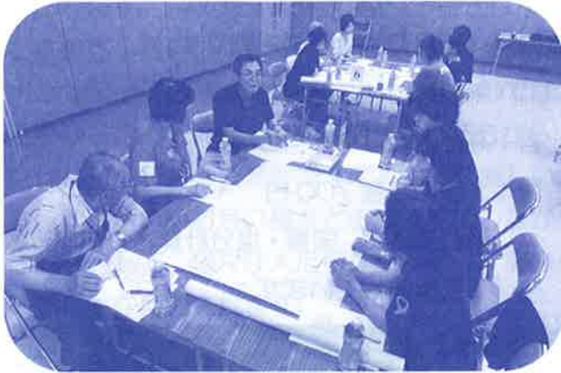
様々な意見が出された演習

演習では、災害ボランティアセンターを設置してからのニーズ（課題等）について、どのように対応すべきか、どんなことが必要となるのかといった事例をあげて、グループに分かれて話し合いました。それぞれが適切な対応策、必要とされる支援について、付箋紙に書き出し、同じ内容ごとにまとめ、課題について整理を行いました。