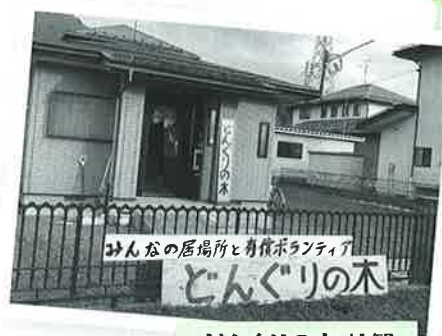
どんぐりの木 外観

生命力の強いどんぐりの木のように、この居場所が末永くつづき、「活動の実」が市内全体に広がっていくことが期待されます。