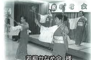
若柳かなめ会様 (平成29年度助成団体)

活動を新たに始めたい、これまでの活動をより発展させたいという皆さんのご応募をお待ちしております！