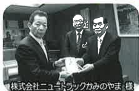
株式会社「ユートラックかみのやま」様