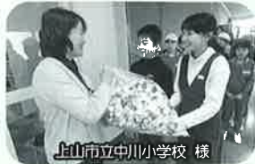
上山市立中川小学校 様