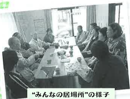
“みんなの居場所”の様子

どんぐりの木では、自分の好きな時間に来て、お茶を飲みながらおしゃべりをしたり、趣味活動をしたり等、自分の好きなことをして過ごすことができます。日替わりで体操、脳トレ、折り紙等の活動メニューがありますが、参加者同士でアイデアを出しあい、活動の幅が広がっているそうです。