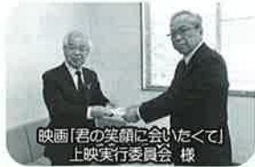
映画「君の笑顔に会いたくて」上映実行委員会 様