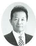
上山市社会福祉協議会

今後とも、市民みんなが住み慣れた地域で安心して生活できる福祉のまちづくり実現のため、皆様のご理解とご協力をよろしくお願い申し上げます。