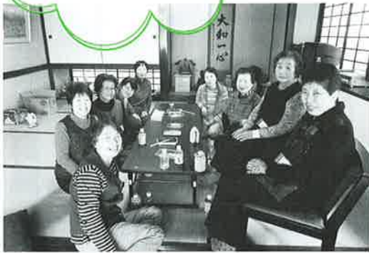
✿ 金生運動教室(仮)の皆さん ✿

「ふれあい・いきいきサロン」は、歩いて行ける地域の居場所（地域交流の場）で、同じ地域の方と出会い、おしゃべりなど楽しい時間を過ごし、そのふれあいの中から生きがいつくり・仲間づくりの輪を広げることを目指しています。