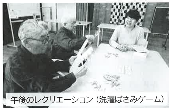
午後のレクリエーション（洗濯ばさみゲーム）