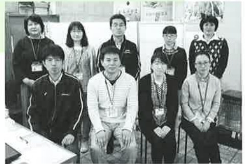
わたしたち、専門職が対応いたします！

～こんな困りごとありませんか？～ 日々このような相談が市民の方から 寄せられています。