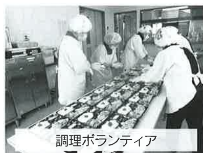
調理ボランティア