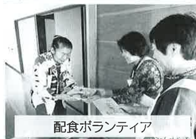
配食ボランティア