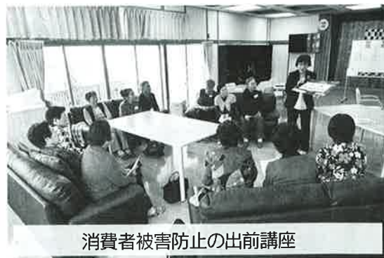
消費者被害防止の出前講座

各事業の料金や利用申込み等についてのお問合せは、上山市老人福祉センター寿荘まで！ ☎ 673-3649