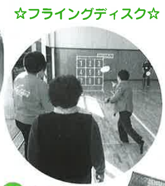
☆フライングディスク☆