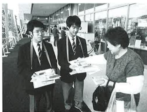
街頭募金活動（県立上山明新館高等学校）