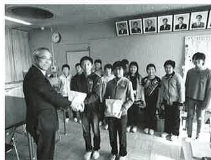
義援金贈呈（市立南小学校）