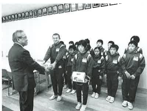
校内募金贈呈（市立上山小学校）