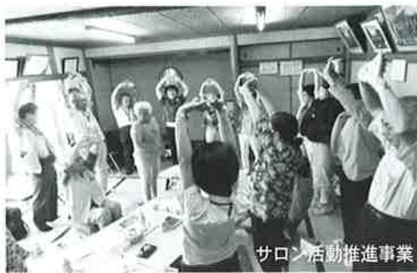
サロン活動推進事業