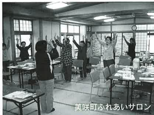
美咲町ふれあいサロン

地区の活動としては、ふれあいサロン、環境整備活動、ラジオ体操、夏まつり、見回り活動、町内広報紙「美咲町だより」の発行等に取り組んでいます。