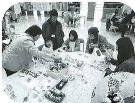
☆松ぼっくりツリーづくり☆