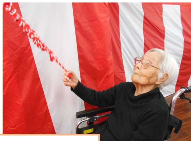
お正月の様子です! 今年もホールに神社を作り皆さんと初詣に行きました。 その後は紅白饅頭を食べお正月を楽しみました。