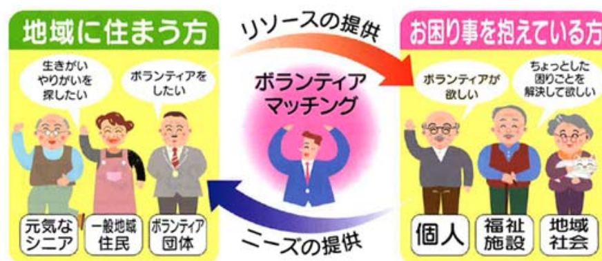
図表 79：ボランティアマッチング事業のイメージ

石巻市におけるモデル事業の内容は、仮設住宅に入居する高齢者に対するボランティアの訪問を中心に、日常生活でのちょっとした困りごと（電球交換・庭の草取り、買い物同行等）を支援する助け合い・支え合い事業（ボランティアマッチング事業）であった。具体的なイメージは以下の通りである。