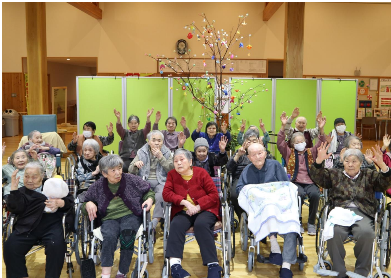
「みずき団子作りより」