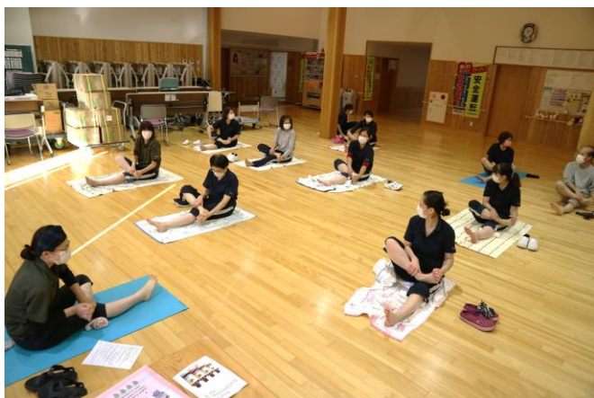
メンタルヘルスケア研修会の様子です。 『フットコンディショニング』を行い血流や骨配列を改善させ、体調を整えました。