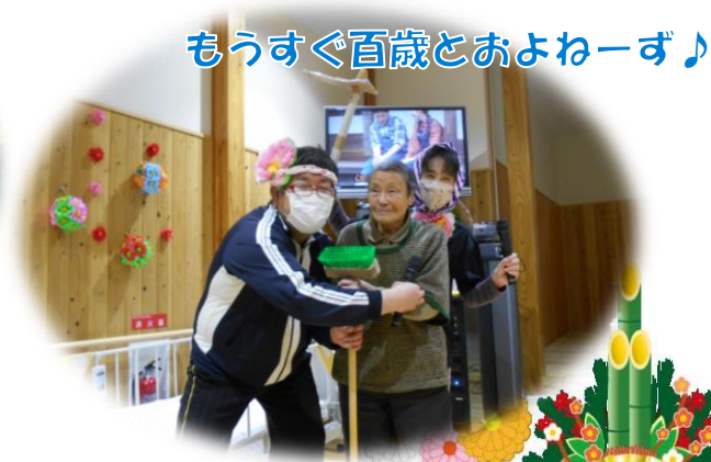
もうすぐ百歳とおよねーず♪