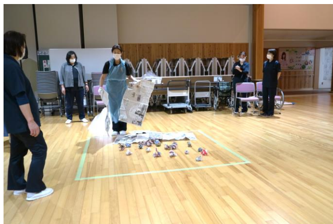
ノロウイルス研修会の様子です。 看護師さんからのお手本を見た後に、それぞれ実地訓練を行いました。