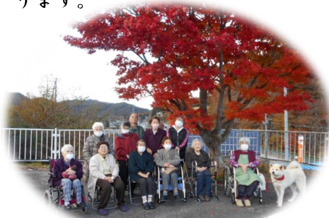
2年ぶりの紅葉ドライブ

新春の候、皆様健やかにお過ごしのこととお喜び申し上げます。 旧年中の皆様のご支援、ご利用に感謝申し上げます。今年も皆様のご多幸をこころからお祈りいたします。また今年も一人でも多くの方に利用して頂けるよう楽しい企画を用意し職員一同お待ちしております。