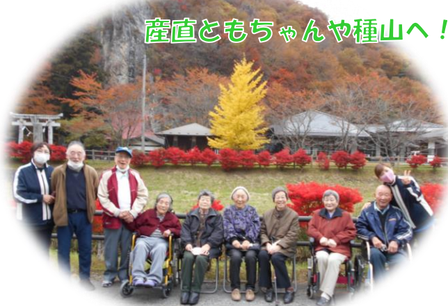
産直ともちゃんや種山へ！