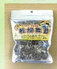
乾燥まいたけ (ちぎり) (20g×6袋)