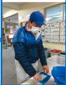
②全体が均一になるよう紙をすく