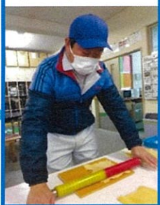
⑤ローラーで紙を平らにする