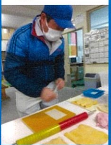
④形成した紙に布で挟む