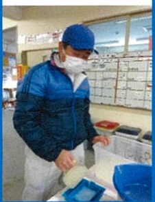
①型枠に流し入れる