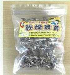
乾燥まいたけ (チップ) (25g×10袋)