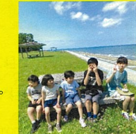
入浴しない方は浜辺でお散歩...

こちらも毎年恒例となっているブルーベリー農園と、初めて、おだいばオートビレッジでコテージで過ごす体験もしてきました。非常食提供訓練の一環としてお昼はカップ麺を食べたり、希望者のみですが、コテージのお風呂で入浴支援も行いました。なかなかできない経験ができました！ 同行・入浴支援のボランティアのご協力も、誠にありがとうございました。