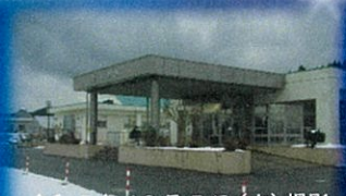
令和5年12月5日(火)撮影