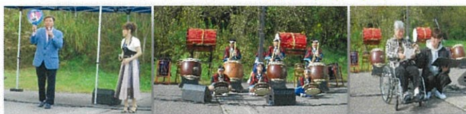
【協賛事業者様一覧】

令和5年10月29日(日) 障害者支援施設かもめ苑敷地内で開催されました「令和5年度かもめ苑地域交流会～夢に向かって～」は盛会のうちに無事終了いたしました。多数の皆様のご来場誠にありがとうございました。 来場者数 約700人