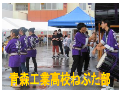
青森工業高校ねぶた部

開催方法についてやアトラクション、飲食物に関して様々なご意見をいただきましたが、今後の開催の参考にさせて頂きたいと思っています。今後も利用者様や来賓の方々が楽しんでいただけるような行事にしたいと思っていますので、今後も宜しくお願い致します。