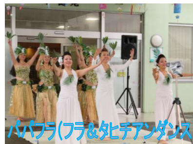
パパフラ(フラ&タヒチアンダンス)