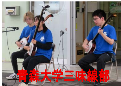
青森大学三味線部