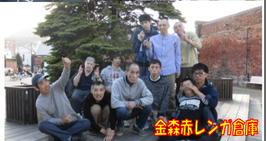
金森赤レンガ倉庫